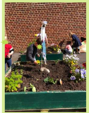
Classe TPS PS MS de Maisoncelle Tuilerie