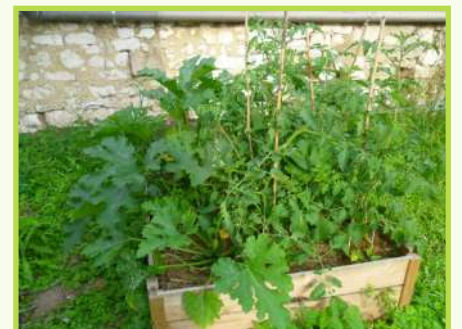
Classe unique (TPS à CM2) école d'Airion de Clermont