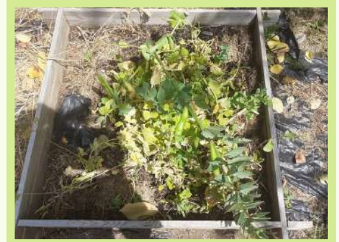
Classes de GS CP CE1 CM1 CM2 de Béthisy St Martin