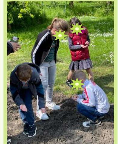
Classe CE1 CE2 de Verderel-lès-sauqueuse