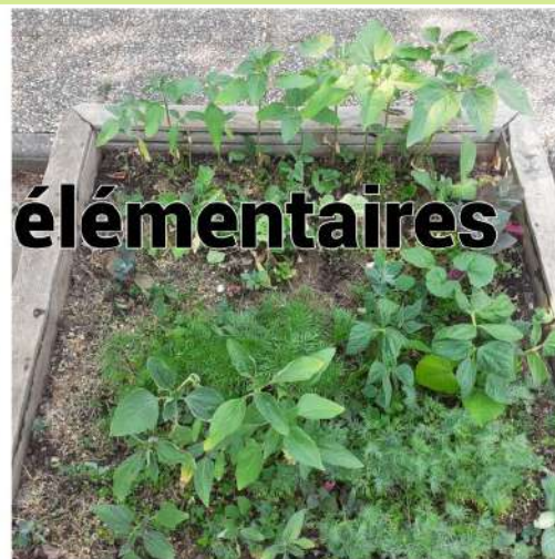
Potagers des élémentaires