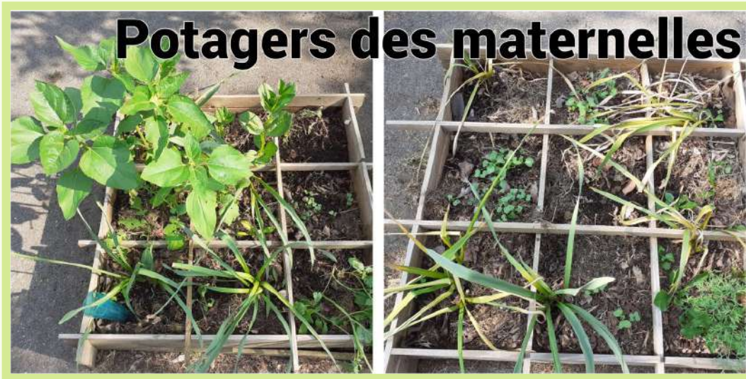
Classes de PS MS GS CP de Jonquières