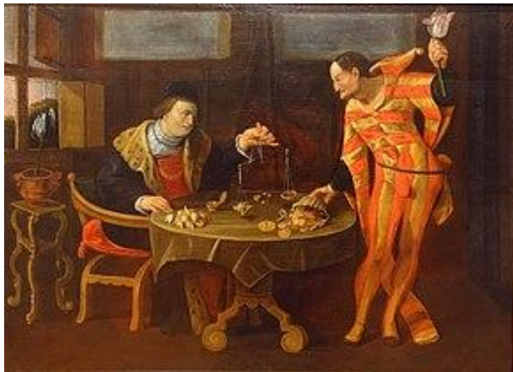
Anonyme, La vente des oignons de tulipe , XVII e siècle. Huile sur bois. Musée des beaux-arts de Rennes .

Cette fleur, dont l'origine est sauvage fut cultivée pour la première fois en Perse . La tulipan dont le nom provient de sa forme en turban fit l'objet d'un premier développement par Soliman le Magnifique . On la retrouve partout : sur les tissus, les faïences et même les pierres tombales. Des traités lui seront consacrés. En 1554, C'est Charles de l'Ecluse directeur des jardins de l'empereur Maximilien à Vienne qui lance leur présentation en Europe en les montrant comme une espèce nouvelle et rare. Lorsqu'il s'installe aux Pays Bas, il développe sa collection et la passion pour cette belle éphémère n'aura plus de limite. Les prix s'envolent notamment pour celles qui montrent des taches de couleur sur les feuilles, en raison d'un virus. La tulipe devient la représentation d'un statut social élevé. Les peintres hollandais au XVII e Siècle dénonceront cette folie dans leurs peintures où elle sera exposée en Vanité.